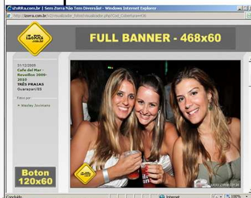
POP-UP VISUALIZAÇÃO DE FOTOS